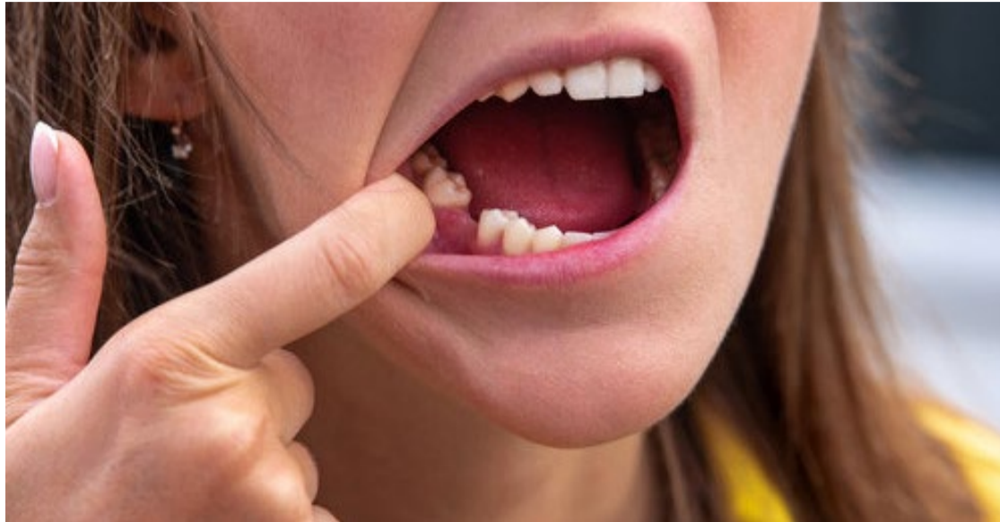
Resultados foram tão promissores em animais que em breve será testado em cobaias humanas