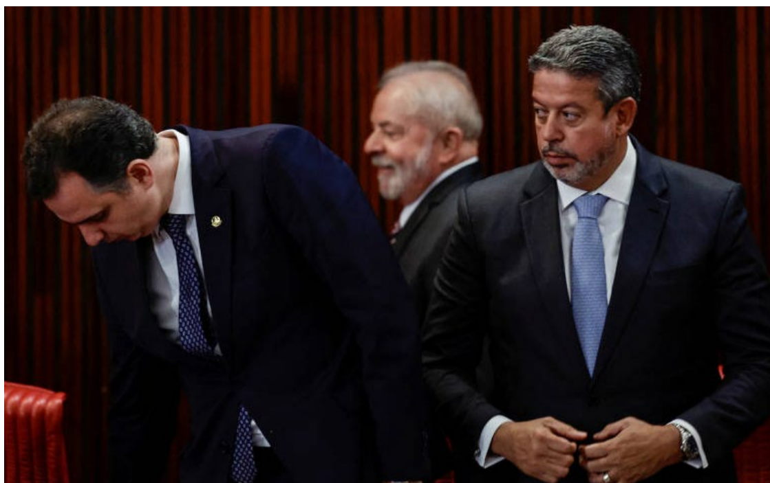
Rodrigo Pacheco, Lula da Silva e Arthur Lira: diálogo entre os poderes

A informação de que o presidente pretende se reunir com presidentes de partidos e lideranças do Congresso foi repassada pelo líder do governo na Câmara, José Guimarães (PT-CE), a vice-líderes do governo em reunião na manhã desta terça-feira (4). Ele sinalizou que isso poderá ocorrer ainda neste semestre, mas não há ne-