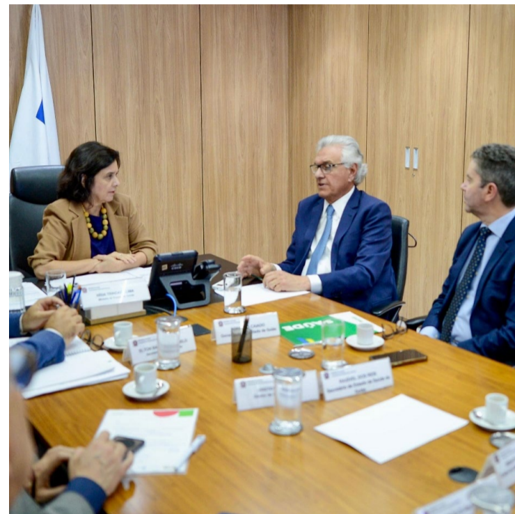
Governador Ronaldo Caiado e ministra Nísia Trindade tratam de repasse de recursos para Goiás