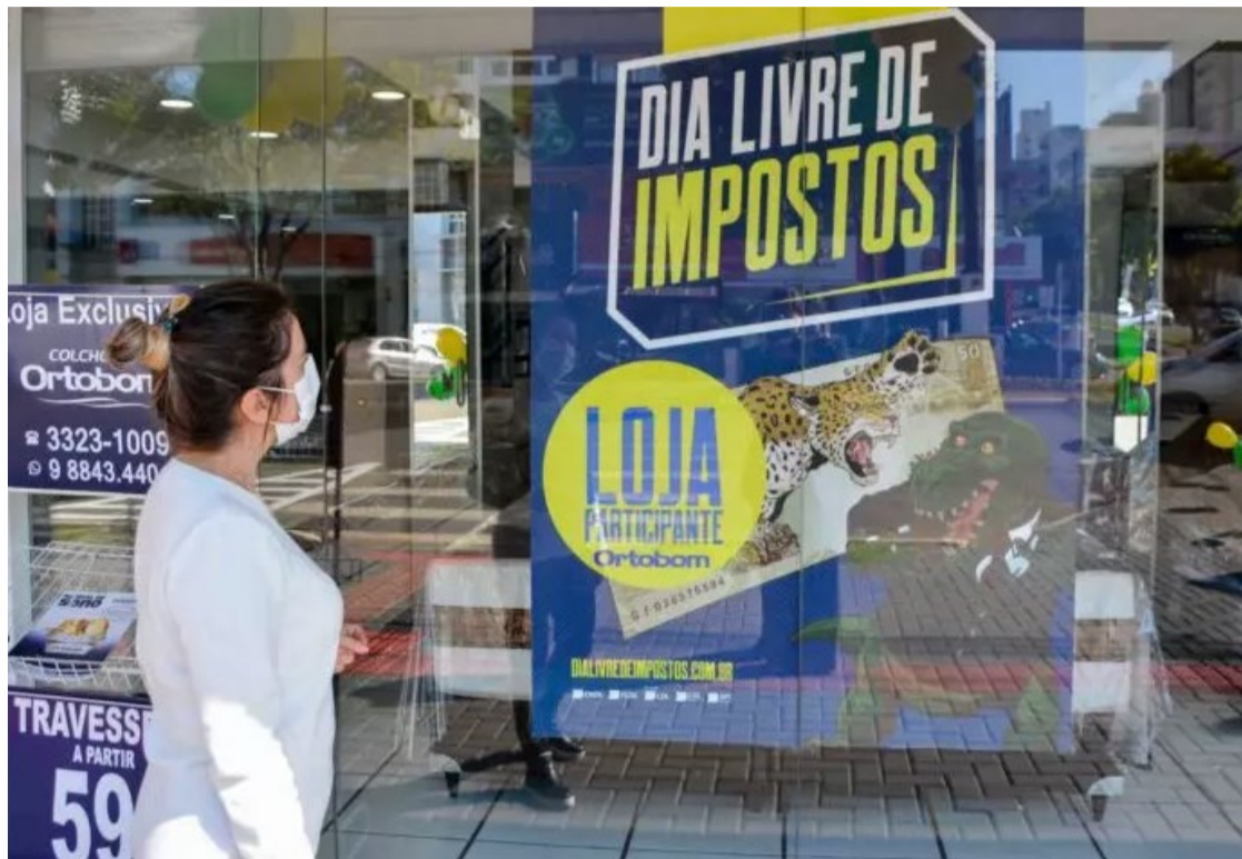
Data foi criada com o intuito de conscientizar a população sobre a alta carga tributária paga no País

“O cenário positivo não elimina desafios importantes no setor, como ajustar operações omnichannel [vários canais de comunicação], acompanhar a constante mudança do comportamento do consumidor e, principalmente, equacionar a elevada carga tributária, a pressão inflacionária e a quitação de compromissos financeiros assumidos ao longo da pandemia”, diz.