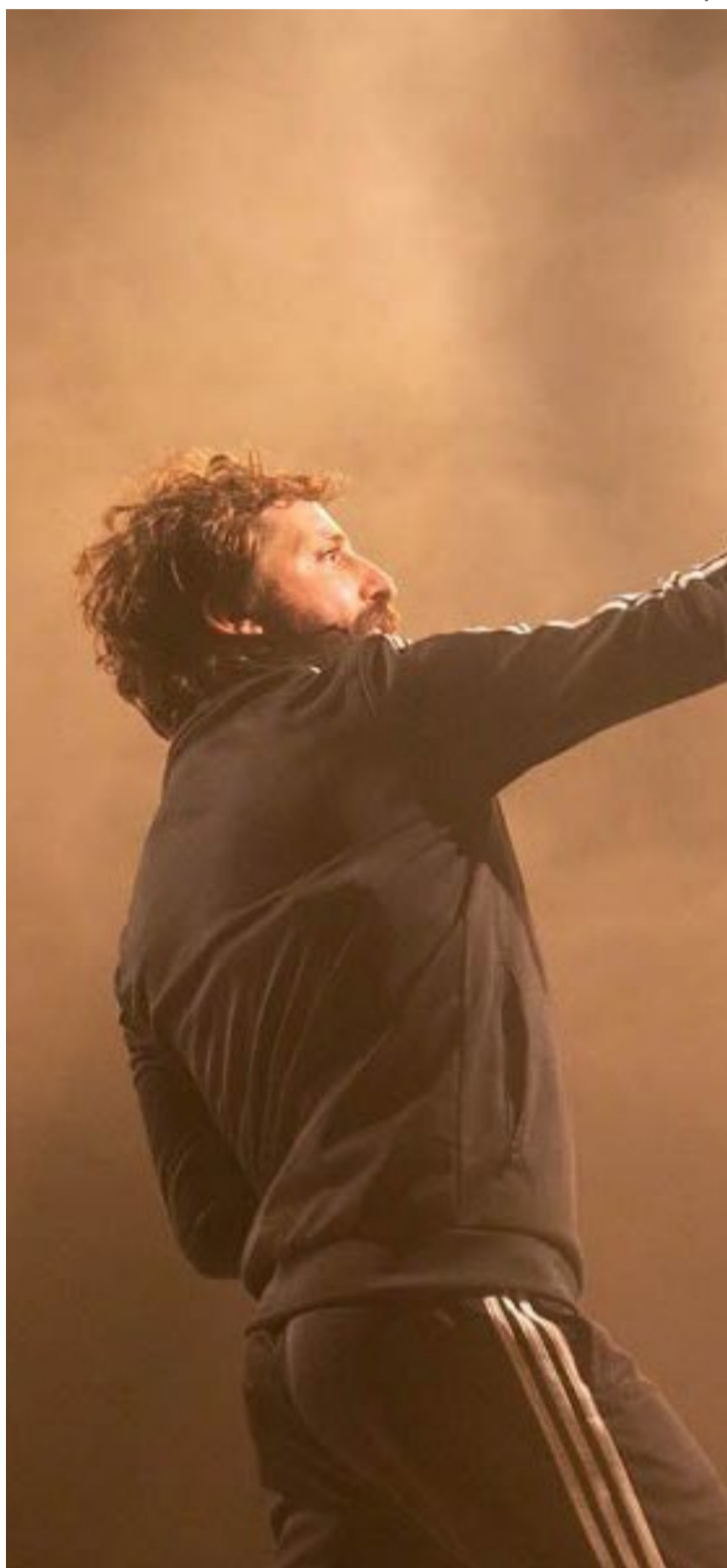
Gregório Duvivier participa de festival com monólogo 'Sísifo', espetáculo aclamado pela crítica no eixo Rio-SP

A edição de 2024 da MIT Catalão foi pensada para ser de forma intercalada ao longo de seis meses para permitir uma adesão maior de diversos públicos, democratizando o acesso ao teatro e inseri-lo no cotidiano da população local.