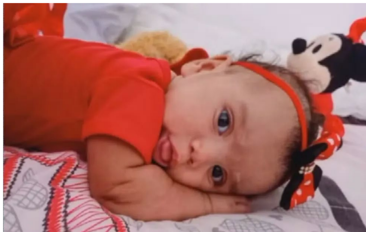
Cachorro da família escapou por um buraco na grade e atacou a menina

De acordo com informações, os pais teriam saído para fazer compras e deixado a criança dormindo no sofá de casa