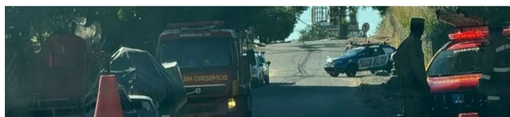
Ao todo dez viaturas da Polícia Militar e do Corpo de Bombeiros foram ao Morro da Serrinha