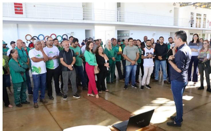
Prefeitura de Goiânia debate criação de gerência para mudanças climáticas

Com a criação da gerência de estudos de mudanças climáticas, o titular da Amma adiantou que serão produzidos estudos sobre o tema, por técnicos capacitados da Amma, que já começaram a apresentar sugestões e estudos preliminares de projetos a serem implantados em Goiânia.